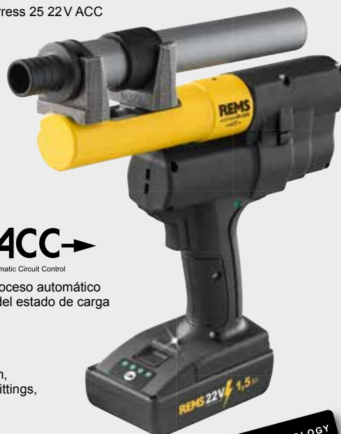
REMS Ax-Press 25 22V ACC

Diversos expandidores de tubo y completo surtido de cabezales de expandir REMS para todos los sistemas convencionales de casquillo corredizo (página 227–231).