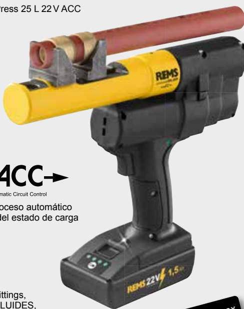
REMS Ax-Press 25 L 22V ACC